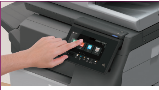
Sharpin palkittu käyttöliittymä - kehitetty helpottamaan elämää.

Sharpin laitteissa on LCD-pyyhkäisy näytöllä varustettu käyttöpaneeli sekä palkittu helppokäyttöliittymä*, jonka avulla luot intuitiivisen näytön ja saat helposti käyttöösi yleisimmät toiminnot. Voit myös räätälöidä käyttöpaneelin omaan toimintatapaasi sopivaksi valikon kuvakkeita vetämällä ja pudottamalla.